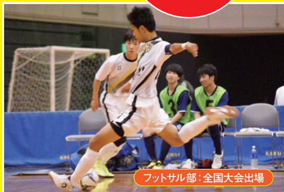
フットサル部: 全国大会出場