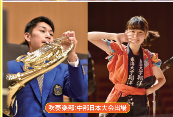
吹奏楽部: 中部日本大会出場