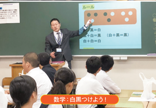
数学: 白黒つけよう!