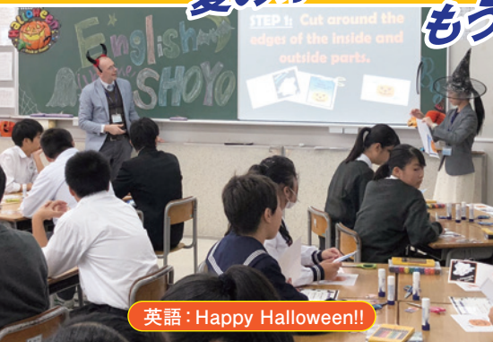
英語: Happy Halloween!!